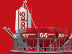
Yem Hazırlama Sistemi

Deneyim, özveri ve küresel bir vizyon. Bize katılın!